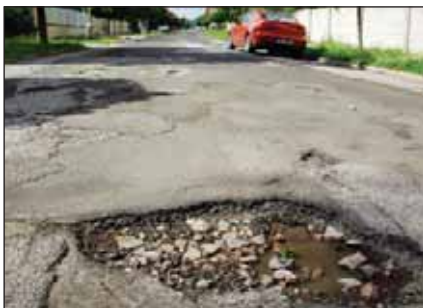
Podobně jako Argonská ulice je v Jičíně rozbitých asi 30 procent místních komunikací