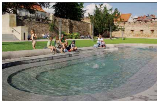
Jičín, Zámecký park

Na přetřes se nejprve dostala situace na radnici a v 21členném zastupitelstvu. „Po loňských komunálních volbách se stal Jičín i jeho zastupitelstvo jedním z nejvíce zpolitizovaných v kraji, tvrdě se to zde polarizuje,“ uvedl P. Kebus. Příčiny spatřuje mj. v oslabení ODS v listopadových volbách, které sice vyhrála, avšak už jí tak jako v předešlých obdobích nestačila k vytvoření pohodlné většinové koalice pouze ČSSD, museli přibrat ještě dva zástupce TOP 09, aby měli alespoň těsnou koaliční většinu. „Někdy je to k prospěchu, jindy