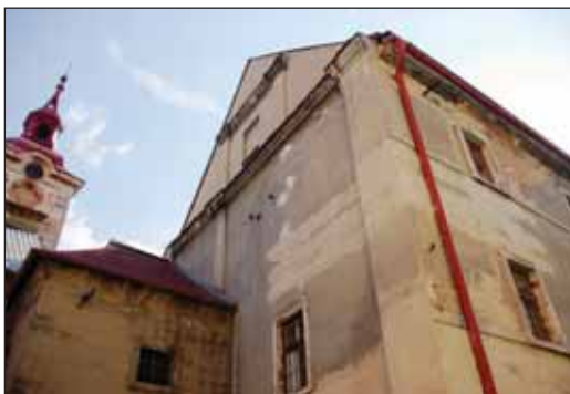
Bývalá Jezuitská kolej v historickém centru Jičína je v dezolátním stavu

Jak jsme naznačili v úvodu, i krásné město Jičín má své vady na kráse. Jednou z nich je dnes už dezolátní stav opuštěné budovy někdejší jezuitské koleje v historickém centru, prakticky spojené s gotickým kostelem sv. Ignáce (jenž už je také značně ohlodán zubem času). „Již záhy po odchodu Sovětské armády, jež měla v koleji kasárna, se z radnice ozývaly hlasy, co vše je připraveno, ale ani po 20 letech není vyřešeno nic.