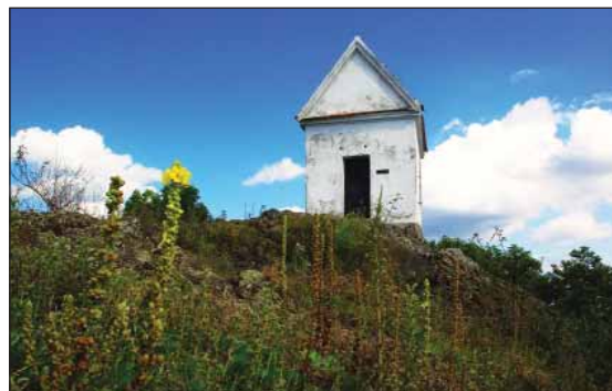
Již zdaleka viditelnou dominantou Jičína je vrch Zebín (399 m)