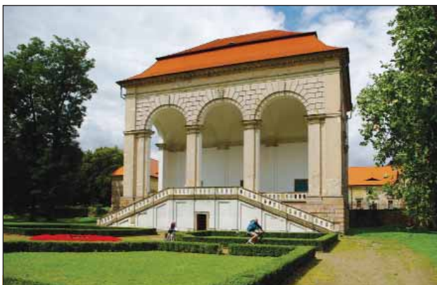
Lodžie z let 1632–1634

dové historii bylo v koalici smlouvě zapsáno, že se strany zavazují, že veřejně ani neveřejně nebudou jednat s KSČM.“